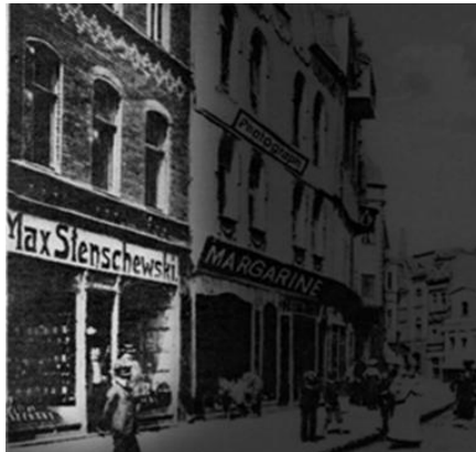
Manufakturwaren, Lauenburg